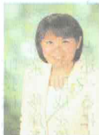
衆議院議員 もとくぼのぶ子