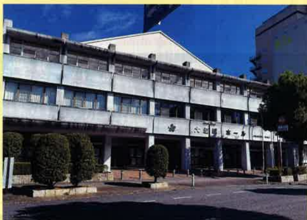
大垣城ホール 大ホール現況

客席 1180席 (2階観覧席ベンチシート) バドミントンコート9面 テニスコート3面