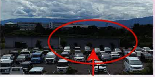
▲2,000万円で建設した ごみ袋倉庫 (クリーンセンター敷地内、受付2Fから撮影)