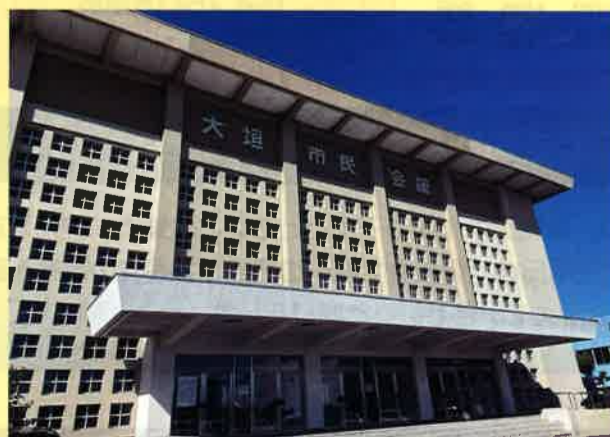
大垣市民会館 大ホール現況

客席 1180席 (2階観覧席ベンチシート) バドミントンコート9面 テニスコート3面