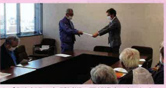
▲ごみ有料化一年間延期の要望提出 (10/28)

主張 ごみ有料化によって無駄遣いが増えました。その一つが ごみ袋倉庫 です。物価上昇が続き、市民の生活は厳しくなっています。ごみ袋有料化は一年延期してシール制度を続けるはどうでしょう。