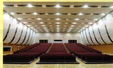
(例 兵庫県 洲本市文化体育館)

客席 1394席 (1階(432席) 2階(570席) 3階(392席)) 電気音響 (オーケストラ用ではない)